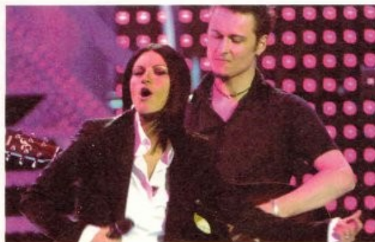
Nella foto a sinistra: Pausini internazionale. Qui è ai Music Awards con un'anteprima del suo nuovo singolo, "Surrender", per il quale ha anche interpretato un video per il mercato americano.